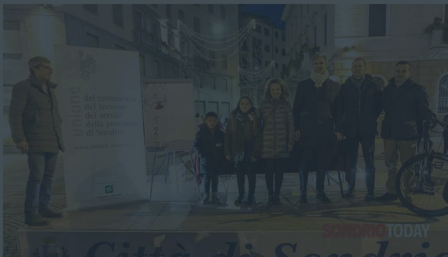
L'estrazione della lotteria natalizia dello scorso anno

Sabato 15 febbraio 2020, alle ore 17, tutti in piazza Garibaldi per l'estrazione dei biglietti vincenti del concorso di Natale 'Sondrio e dintorni', organizzato dall'Unione del Commercio e del Turismo tramite l'Associazione Mandamentale di Sondrio e l'Associazione Sondrio Shopping.