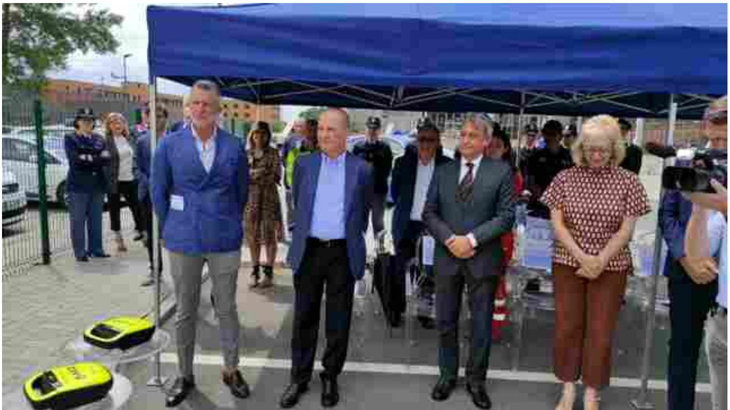
Un momento della cerimonia di consegna

È stata l'area esterna della questura di Monza e della Brianza ad ospitare la cerimonia di consegna di due defibrillatori destinati alle volanti della polizia. Sono stati il questore Marco Odorisio e l'amministratore delegato dell'associazione, Cancro primo aiuto onlus , Flavio Ferrari, che hanno stipulato l'accordo fra i due enti a favore dei cittadini. Presenti alla cerimonia il prefetto di Monza Patrizia Palmisani e rappresentanti della provincia, della Croce rossa e di Areu. Flavio Ferrari ha donato alla questura due defibrillatori che saranno a disposizione degli operatori delle squadre volanti continuamente presenti sul territorio affinché, in caso di necessità o bisogno, possano intervenire a salvaguardia della salute dei cittadini, prestando loro soccorso.